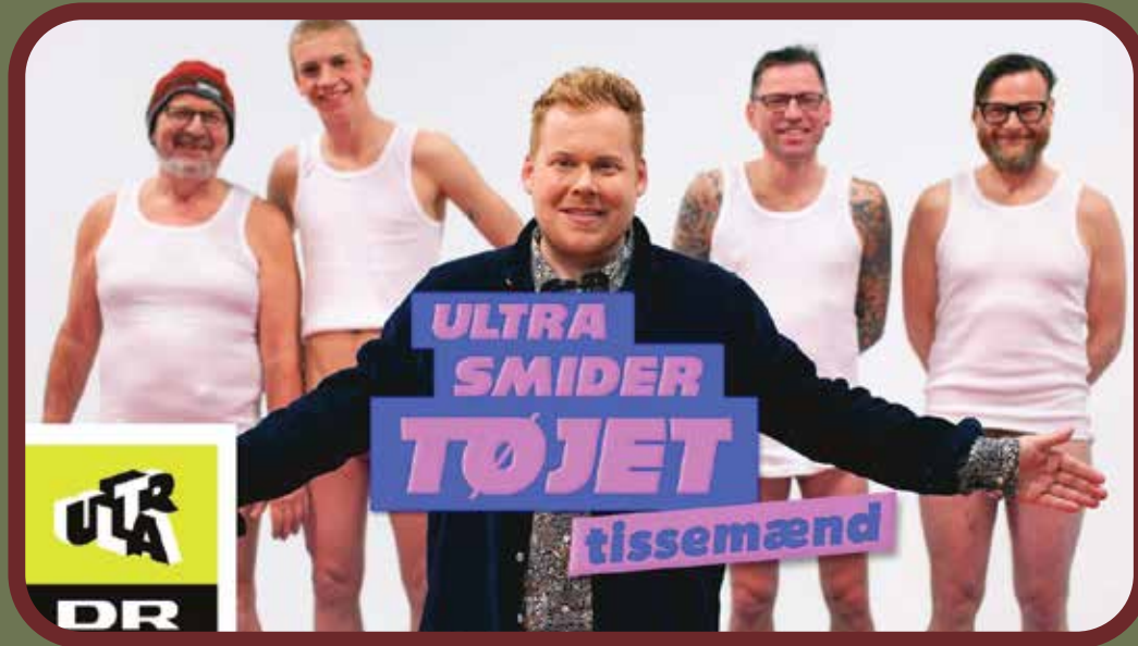
DR Ultra smider tøjet

Udsendelsen starter lige på og hårdt. En gruppe midaldrende mænd står i morgenkåbe og er åbenlyst nøgne indenunder. Studiet er samtidig fyldt med småbørn, der filmes, mens de midaldrende mænd blotter sig, hvorefter nogle små piger og drenge bedes om at vurdere de voksne mænds tissemand.